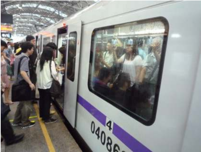
Figure 4 : Rame du métro de Shanghai

Le numéro de la ligne est clairement indiqué sur le flanc du wagon (4, au premier plan), ce qui permet d'informer le voyageur sur cette voie empruntée alternativement par des trains des lignes 3 et 4.