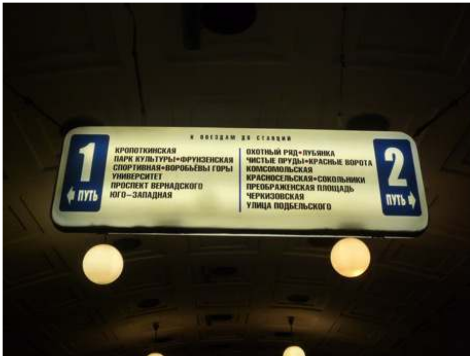
Figure 3 : Signalétique dans le métro de Moscou

Un panneau lumineux indique les stations desservies par les rames de la ligne rouge (voir tableau 3). Cela révèle également le dispositif de quai central séparant les deux voies ou itinéraires (ПУТЬ) 1 et 2, avec les stations desservies dans chaque sens.