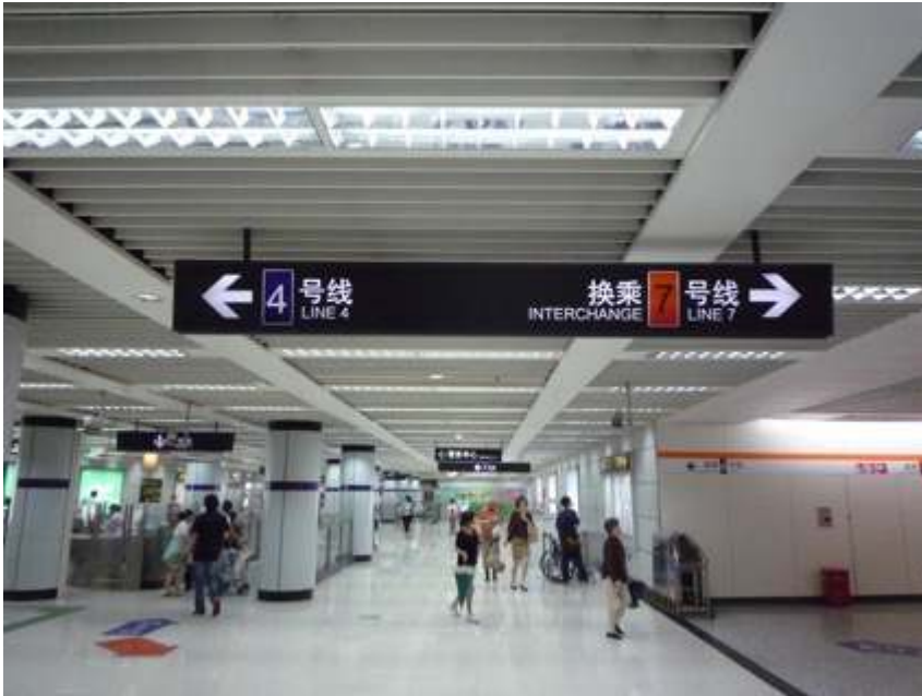
Figure 10. Signalétique au croisement des lignes 4 et 7 à la station de Dongshan Road South

Outre la qualité de la signalétique, cette photo souligne également les atouts d'une construction récente, quand on compare l'espace vaste et clair de la station à l'exiguïté et à l'atmosphère glauque de nombreuses stations du métro de New York – fig. 2.