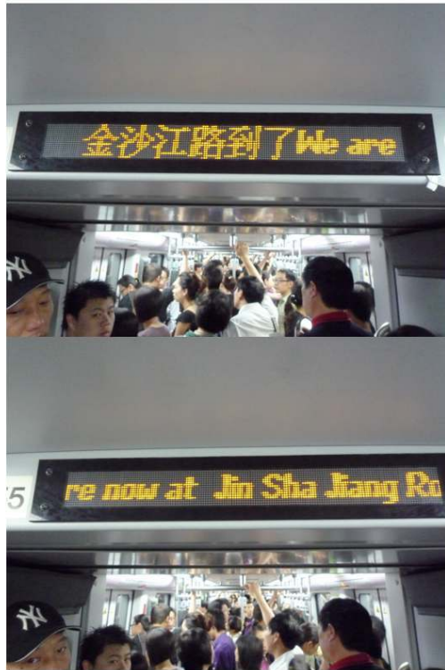
Figure 11 : Information dans les rames à Shanghai

Information dans les rames par affichage lumineux bilingue (ici « [You a]re now at Jin Sha Jiang Road ») et annonce sonore.