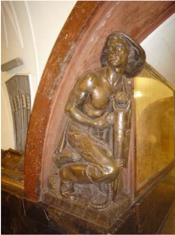
Figure 8 : Le métro de Moscou comme objet touristique

Le métro de Moscou constitue un objet touristique, ici station Park Koulouri ; pourtant l'accessibilité n'est pas facilitée pour les touristes.