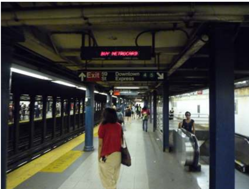
Figure 2. Signalétique dans la station de la 59 e rue à New York

Il est clairement mentionné que le quai au premier plan permet d'accéder aux rames de la ligne 6, express vers downtown , alors que l'accès aux rames des lignes 4 et 5 s'effectue au niveau inférieur accessible par l'escalator situé à l'arrière-plan à droite. La sortie est également clairement mentionnée.