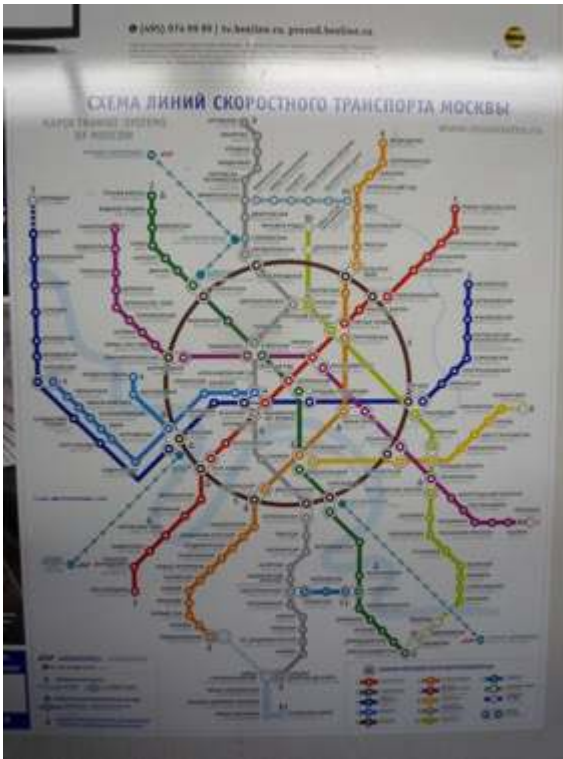
Figure 7 : Plan du réseau du métro de Moscou

La transcription en alphabet latin sur le plan est de peu d'utilité tant que la signalétique du réseau (nom des stations, des lignes...) demeure en cyrillique.