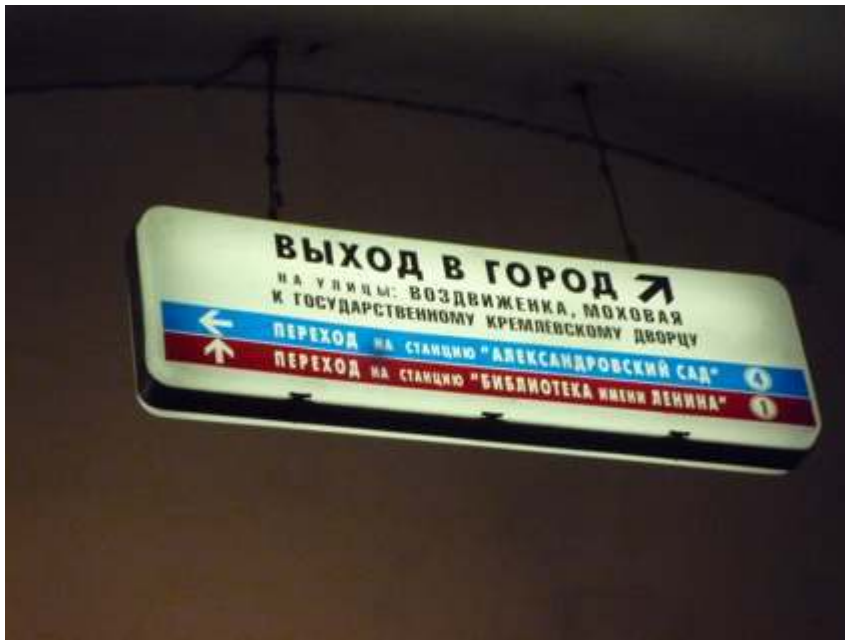
Figure 6 : Signalétique directionnelle à Moscou

Signalétique directionnelle : en haut en noir, indication de la sortie ; en bas en bleu et rouge, les directions vers les deux lignes, la n° 4, bleu clair, vers la gauche, la n° 1, rouge, tout droit.