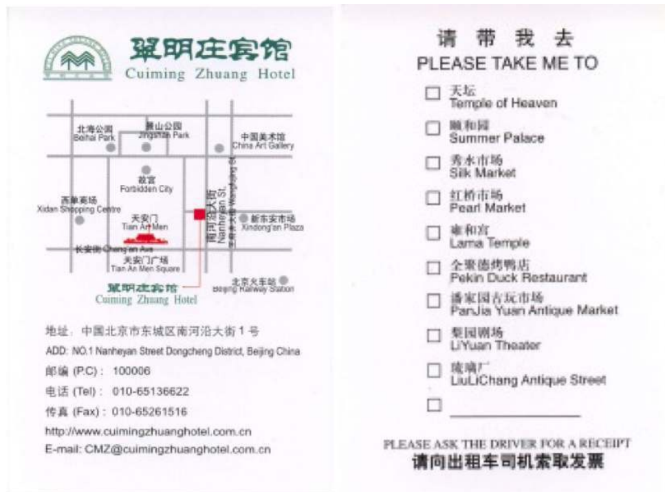
Figure 1 : Fiche cartonnée distribuée dans les hôtels à Beijing

Fiche cartonnée (format carte de visite) distribuée dans les hôtels que les touristes cochent et remettent au chauffeur de taxi à Beijing. Cette technologie permet une découverte autonome de la ville, c'est-à-dire sans recours aux agences réceptives ou aux voyagistes.